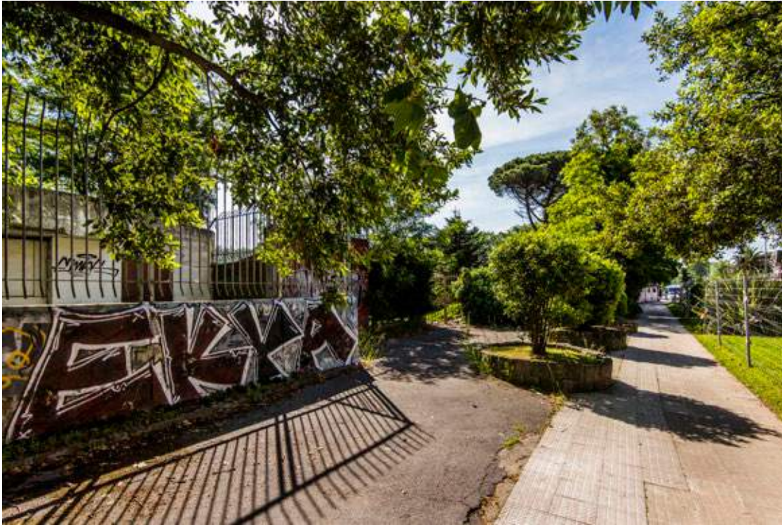
← Pintadak dituen kanpoko hesia Makaleta Etorbidean,