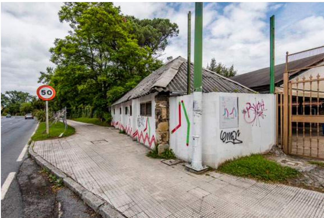
← Kanpoko horma pintadekin Makaleta Etorbidean zehar garagardotegiaren sarrera nagusiaren parean.