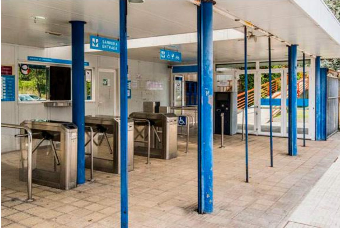
← Frontoien eraikineko tornuen bidezko sarbidea eta segurtasun-kontrola.