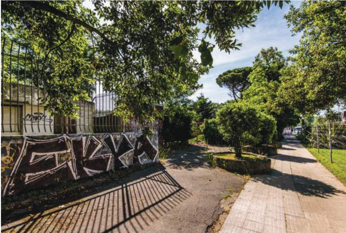
← Valla exterior con pintadas a lo largo de la Avenida de los Chopos.