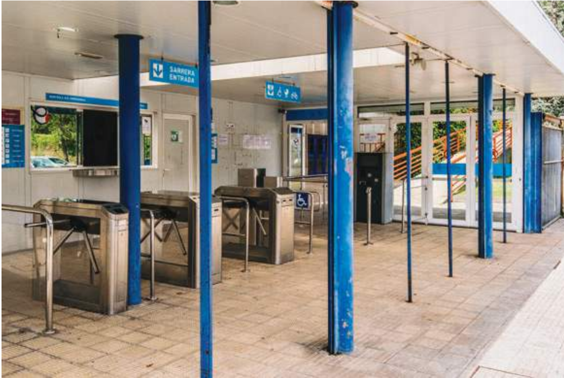
← Acceso con tornos y control de seguridad del edificio de Frontones.