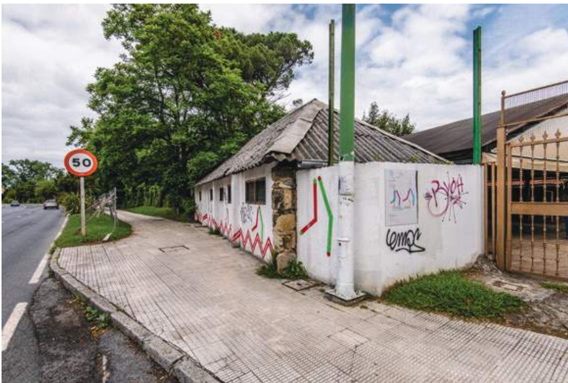
← Muro exterior con pintadas a lo largo de la Avenida de los Chopos a la altura de la entrada principal de la cervecera.