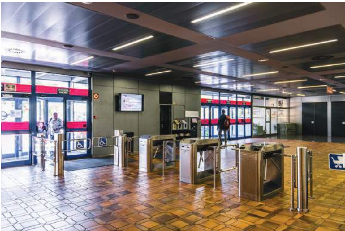
← Tornos de acceso del edificio principal.